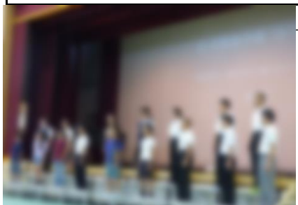
合唱:あなたへ-旅立ちに寄せるメッセージ

6月15日(土)に新島地区音楽会が開催されました。4校そろっての開催は実に5年ぶりです。約1か月の練習の成果を存分に発揮することができた生徒たち。公開リハーサルから大きく成長した演奏にたくさんの方から「よかったよ、すごかったよ」とのお言葉をいただきました。アンケートに「子どもたちは式根島の誇りだ。」と書いてくださった方がいますが、そのとおりだと思います。“音楽を表現することが楽しい”と素直に思えることは大事なことです。この経験をこれからの学校生活で活かしてほしいと思います。