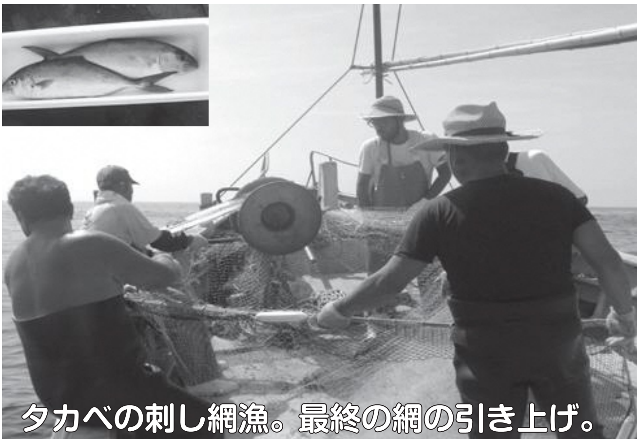
タカベの刺し網漁。最終の網の引き上げ。