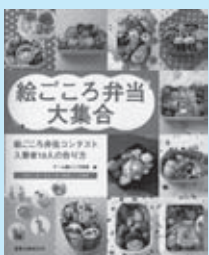
チーム絵ごころ弁当