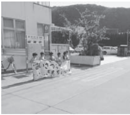
▶あいさつ運動住民センター前(健全育成部の活動)