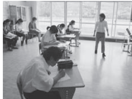
▶研究授業の様子(学習指導部の活動)

新島村の各園校においては、新島村教育委員会のご支援のもと、村の子ども達を「一帯」として育てようと保育園、小学校、中学校、高等学校が連携した教育活動を進めています。