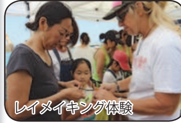
レイメイキング体験