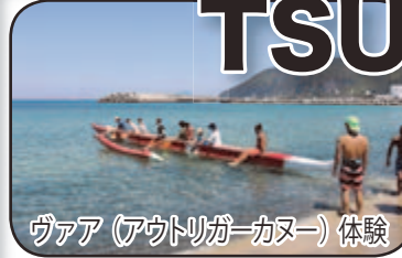
ヴァア (アウトリガーカヌー) 体験