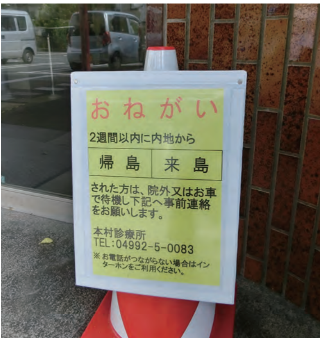
▲島民の命を守る診療所はこれまでも感染予防対策を徹底し、院内感染拡大防止に努めてきた。

の上、重症化のリスクがあるか、総合的に判断しへり搬送を決定する。東京都は、7月、8月、9月のはじめコロナウイルスとの闘いで、現在最大の危機と言っても過言ではない状態である。病院の収容能力は