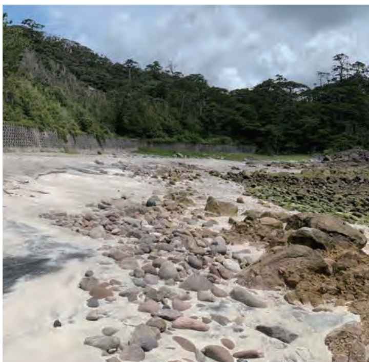
▲岩場と化してしまった石白川海岸