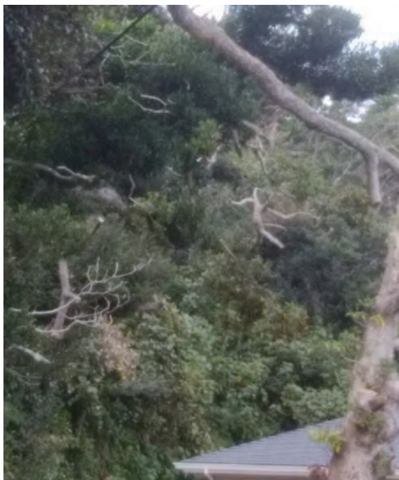
▲村道沿いの枯れ枝の1コマ

旬から7月中旬にかけて毎年。「松くい虫地上撒布」は式根島のみ、松枯れの原因となるセンチウを運ぶカミキリが越冬木から出てふ化する最盛期の6月下旬から7月下旬に毎年2回撒布している。この3事業は都や国から1/2補助を受けているが、降雨、降雨予想等は撒布できない条件が付いている。