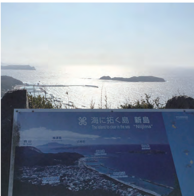
▲自治体運営には新島村民一人一人が新島村の担い手であり、自治の主役であるという意識改革も必要。

自治体運営には住民の皆様の協力が必要だと思う。しかしながら条例等の制度化は、対象となる事業の続きを、そのルールどおりに行うことになるので、行