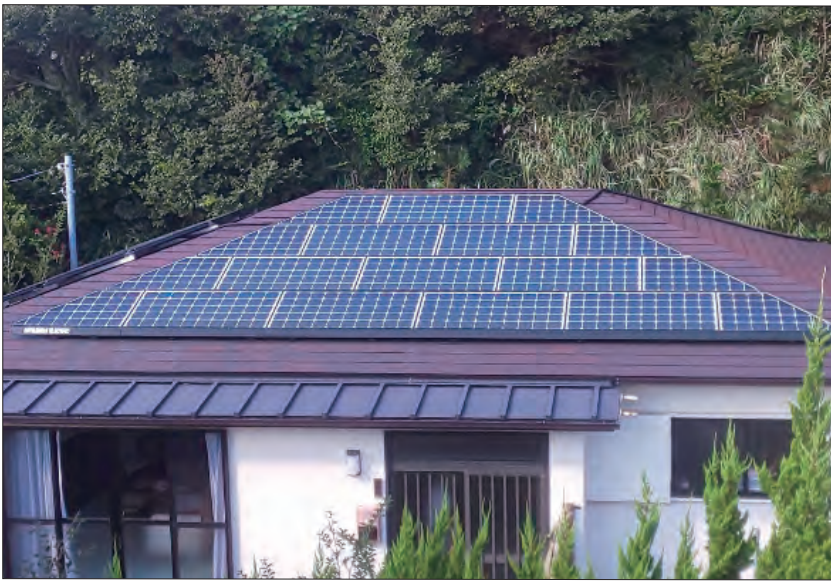
▲住宅の屋根に設置された太陽光発電パネル

答 地球温暖化の原因となる、温室効果ガスの排出削減等の環境保全対策に取り組むことは行政の責務と考える。村単独での取り組みは、知見・財源等難しい。「地球温暖化防止と自然エネルギーの活用」と位置づけ、CO 2 削減を目指す。現在、具体化されている計画はない。