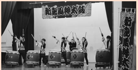
風 神 子 度 未 発 表 会