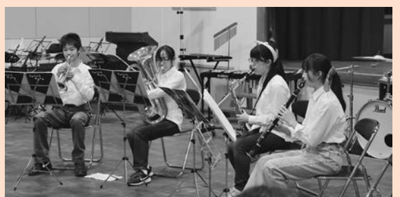
ハ コ フ ネ キ カ ク コ ン サ ー ト