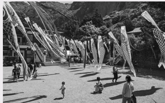
舞い上がるこいのぼり

4月29日(月)から5月5日(日)子どもの日にかけて、若郷妙蓮寺境内にこいのぼりが飾られました。5月4日(土)には物品販売が行われ、若郷産の野菜や、弁当、コーヒー等手作りの食品、妙蓮寺のご朱印帳などが販売され、賑わいを見せました。