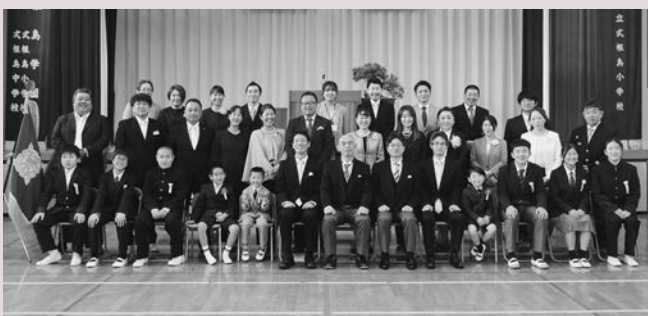
▲式根島学園 (小・中学校)