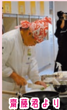
齋藤君よりコメント

式根島の知名度を上げるために学習や特産品を使った調理に取り組みました。最初は味がとても薄くなったたり、パラパラにならなかつたりする時もありましたが、地域の方から助言を貰い上手に炒めることができました。式根島の魅力を沢山の方に知って貰えたと思います。