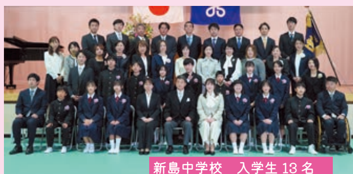
新島中学校 入学生 13 名