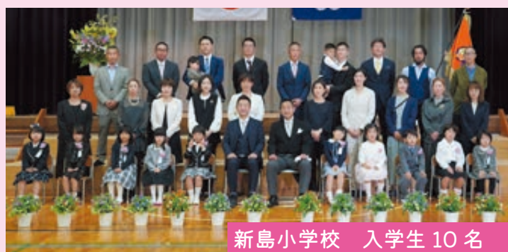
新島小学校 入学生 10 名