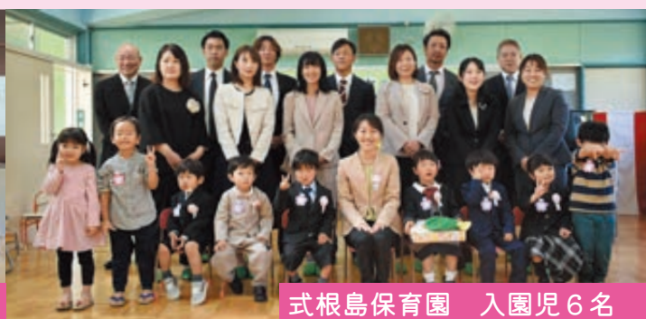
式根島保育園 入園児 6 名