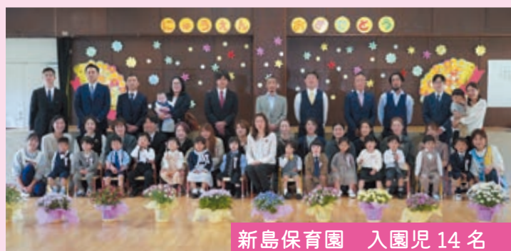
新島保育園 入園児 14 名