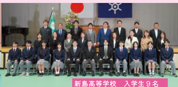
新島高等学校 入学生 9 名

4 月中、新島・式根島両島の各保育園、小学校、中学校、高等学校で令和 8 年度入園式・入学式が行われました。今年度両島保育園の合計園児数は 48 名、小学校の合計児童数は 96 名、中学校の合計生徒数は 59 名、高等学校の合計生徒数は 35 名でスタートを迎えました。新たな場での学びが実り多きものとなるよう、お祈り申し上げます。