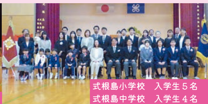
式根島小学校 入学生 5 名 式根島中学校 入学生 4 名