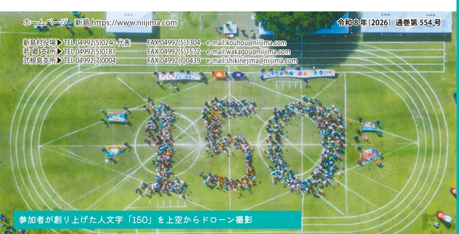
参加者が創り上げた人文字「150」を上空からドローン撮影

FAX 04992(5)1304 e-mail:kouhou@nijijima.com FAX 04992(5)1572 e-mail:wakagou@nijijima.com FAX 04992(7)0439 e-mail:shikinejima@nijijima.com