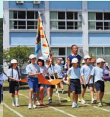
▲大漁旗と入場する低学年児童