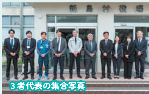
3者代表の集合写真

近年、台風などの自然災害による停電リスクが高まっています。東京都の島しょ地域では、一度停電が発生すると、電力設備の特性上、復旧までに時間を要する場合もあり、「もしもの時に電力をどう確保するか」が課題となります。