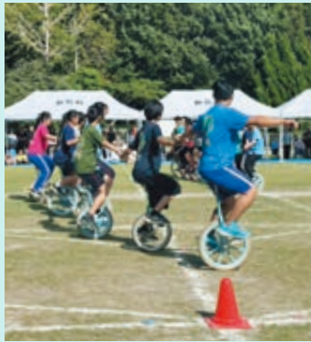
▲伝統だった一輪車が復活！

午後には、「新島小学校開校150周年を記念する会」主催による記念運動会が行われ、卒業生や地域の皆さまとともに、世代を超えて150周年を祝いました。学校・家庭・地域が一つになり、子供たちの笑顔があふれる、記念の日になりました。