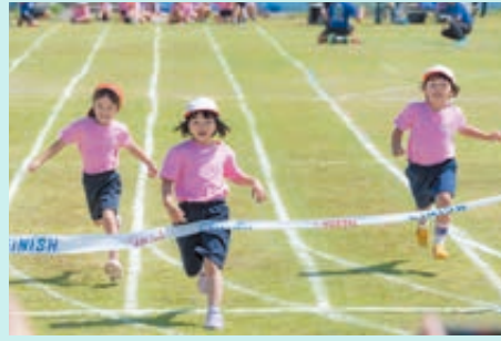
初めての小学校運動会！1年生の徒競走▲

5月30日、新島小学校校庭にて新島小学校記念運動会が開催されました。当日は、開校150周年の節目にふさわしい爽やかな晴天に恵まれ、記念運動会が盛大に開催されました。