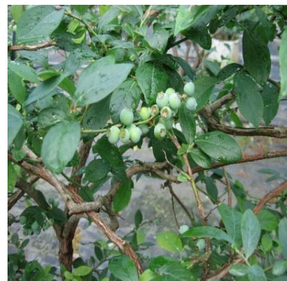
▲これから熟すブルーベリー

このシステムにより、通常の地植えの倍近いスピードで育てることができ、ブルーベリーは酸性度を好むので、「リン酸液」を加えて常にPH管理が必要となる。