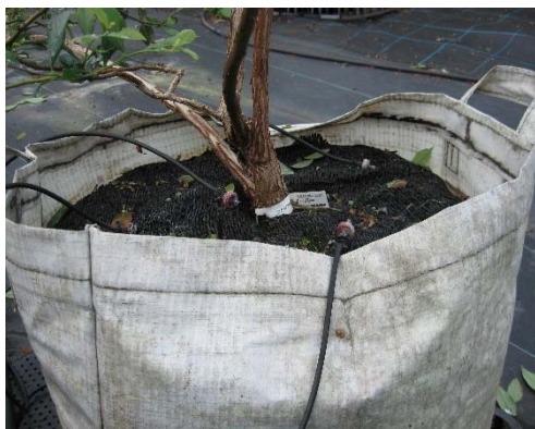
▲バックカルチャーシステム